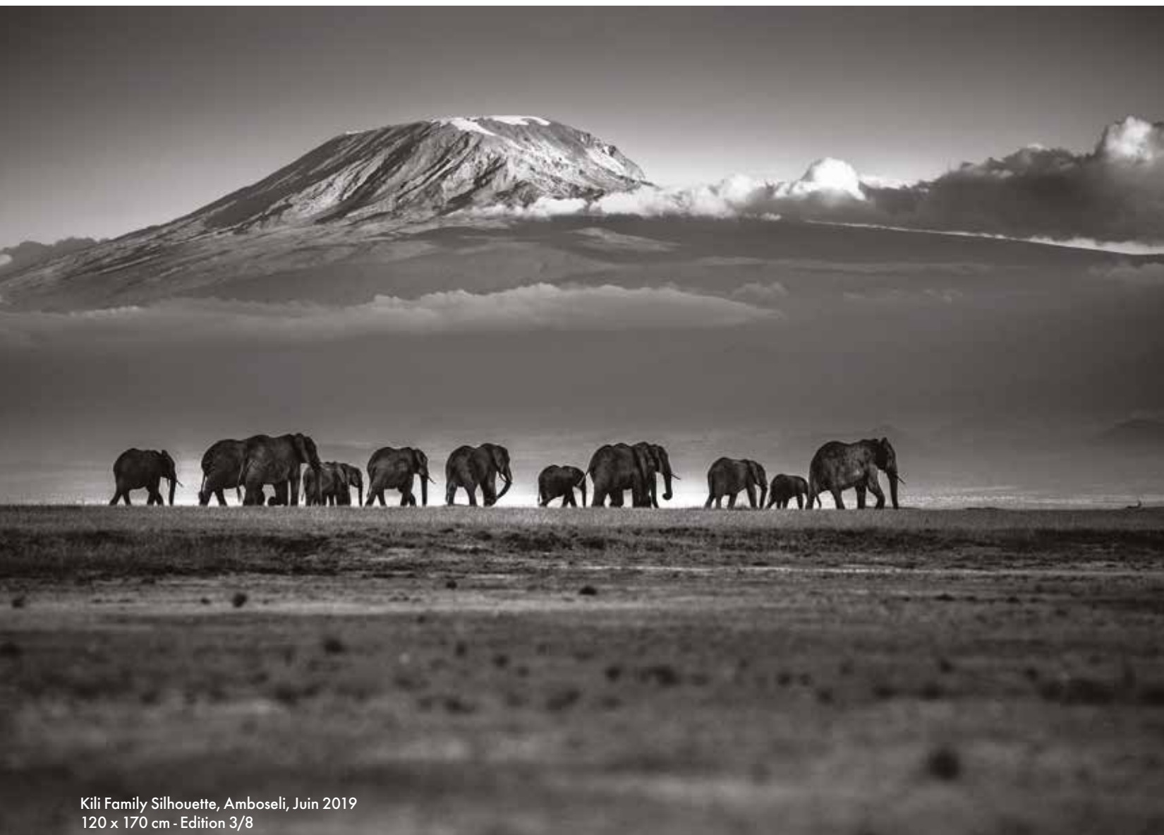
Kili Family Silhouette, Amboseli, Juin 2019 120 x 170 cm - Edition 3/8