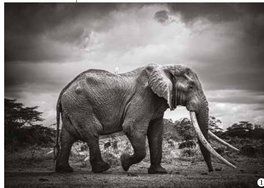
1 Tim Right Profil, Amboseli, Juni 2019 - 120 x 170 cm - Edition 2/8 2 Peaceful, Bwindi, Uganda, Maart 2020 - 120 x 170 cm - Edition 1/8