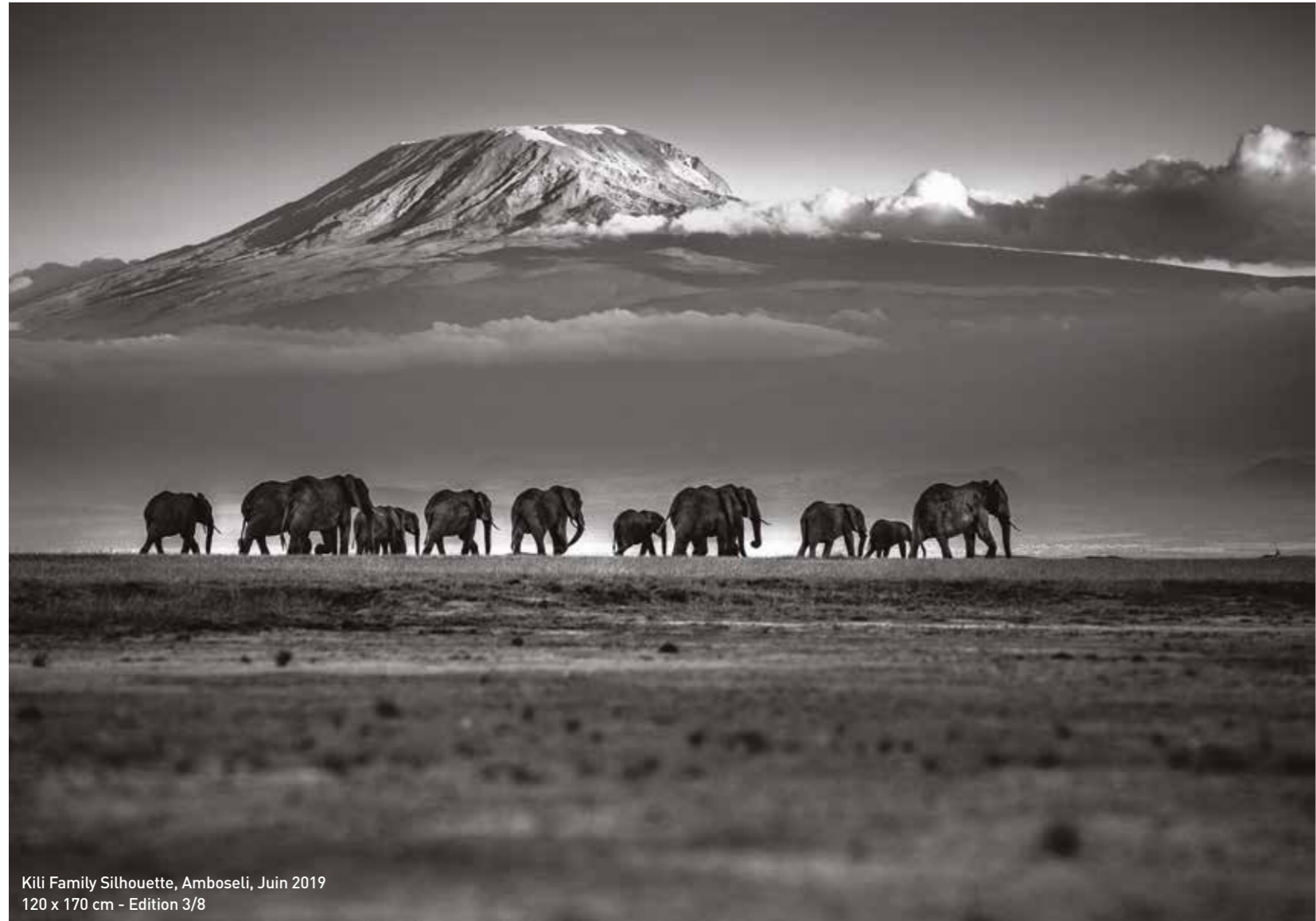
Kili Family Silhouette, Amboseli, Juin 2019 120 x 170 cm - Edition 3/8