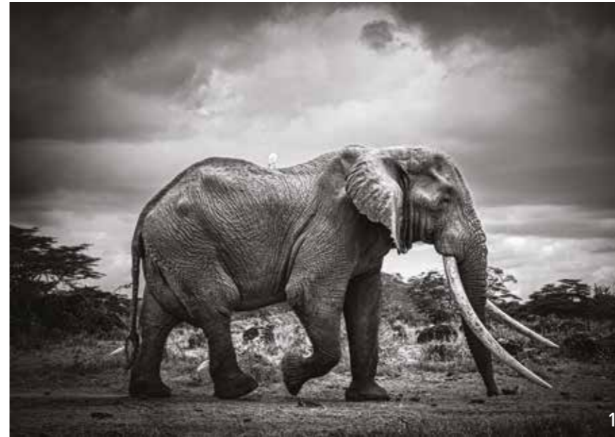
1. Tim Right Profil, Amboseli, Juin 2019 - 120 x 170 cm - Edition 2/8 2. Peaceful, Bwindi, Uganda, Mars 2020 - 120 x 170 cm - Edition 1/8